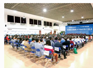
2015年,北京市人民政府与住房和城乡建设部共建北京建筑大学。