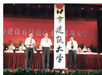
2013年,学校正式更名为北京建筑大学。