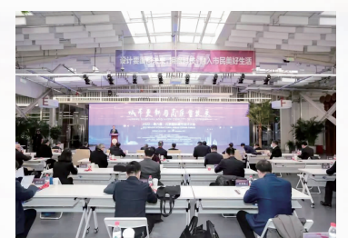
2022年,北京建筑大学在主办的2022(第六届)北京国际城市设计大会上发布《北京建筑大学服务北京建设人民城市三年行动计划》。