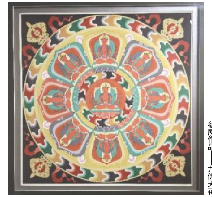
参展作品——九佛天花