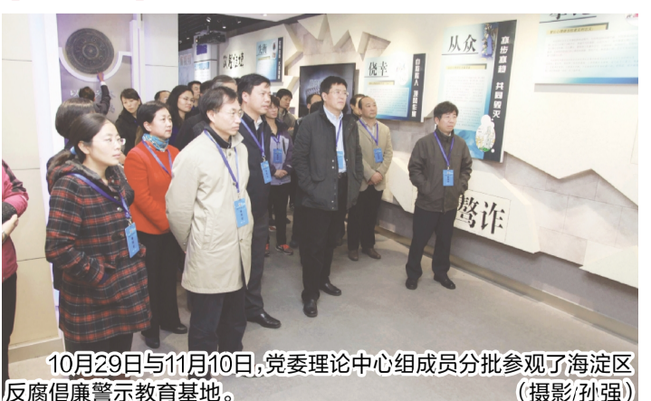
10月29日与11月10日,党委理论中心组 members 分批参观了海淀区反腐倡廉警示教育基地。